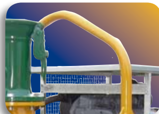
Potence de levage